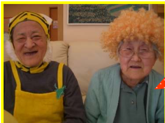
1丁目では、利用者様も鬼になってみました。