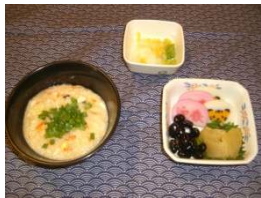
1月1日の朝食は、雑炊が出されました。

新年明けましておめでとうございます。いよいよ平成22年の幕開けです。新年恒例となりましたが、元旦当日は利用者様にもゆっくりと過ごしていただき、御屠蘇が出たり、昼食には御節料理が出たりとお正月気分を満喫しました。また、2月には節分を行い皆で大きな声で「鬼は外～！福は内～！」と言いながら鬼役の職員に豆を投げていました。