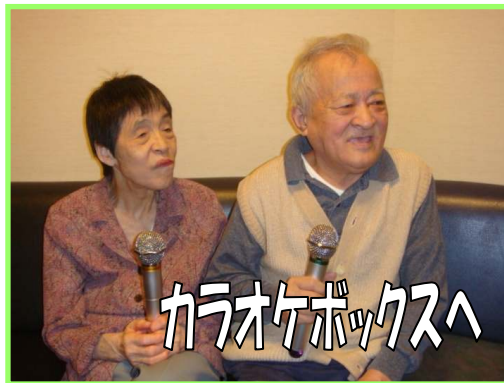
カラオケボックスへ