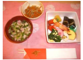
昼食は、御節が出されました。