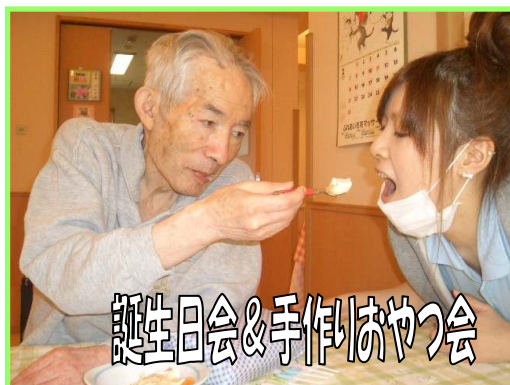
誕生日会&手作りおやつ会