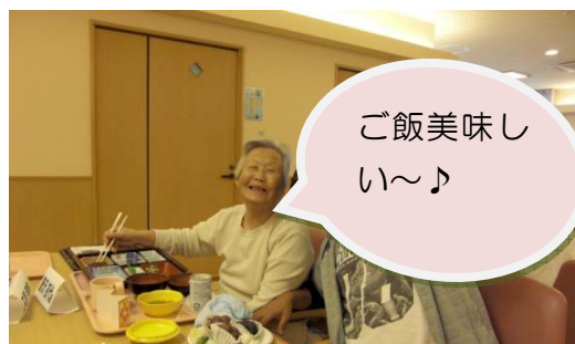
↑ 皆さん笑顔あふれる食事会でした。